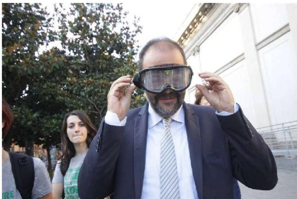
Colonne, gli occhiali «effetto sbronza»